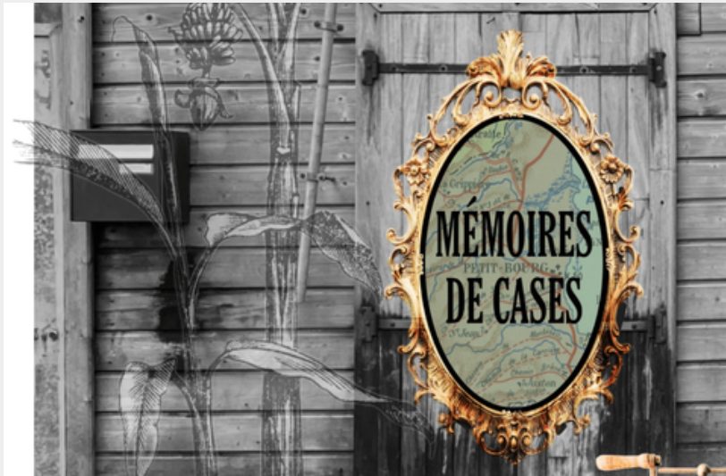
visuel du projet artistique (CeDo)