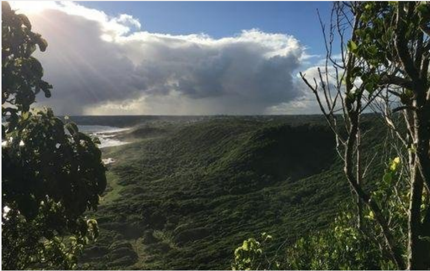
point de vue (AAMG)