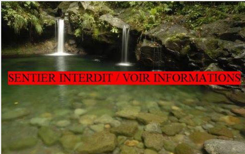
Cascade "Paradise" sur la rivière Grosse Corde