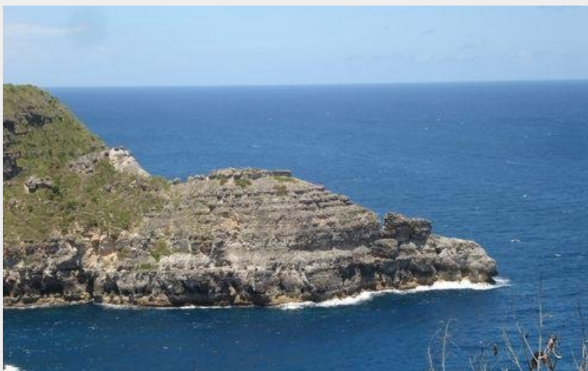
"La Tortue" (PNG)