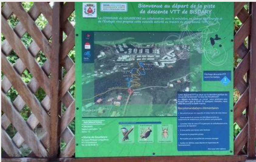
panneau départ (PNG)