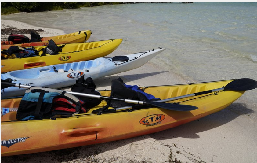
(Sortie de découverte du Grand-Cul-de Sac Marin en kayak)