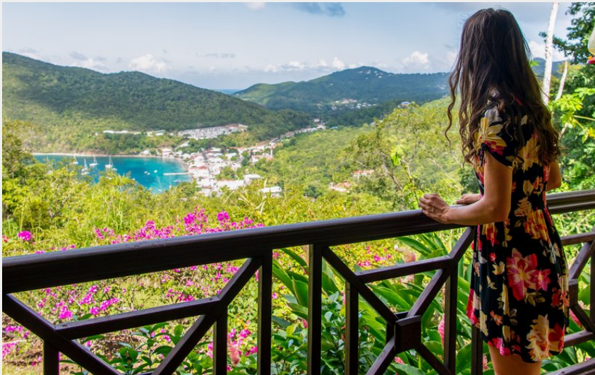
Crédit : Jardin des colibris - gîtes et lodges - terrasse (© Lara Balais - Parc national de la Guadeloupe)