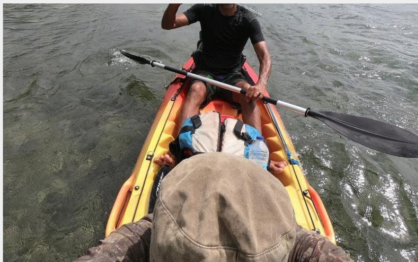
(Sortie de découverte du Grand-Cul-de Sac Marin en kayak)